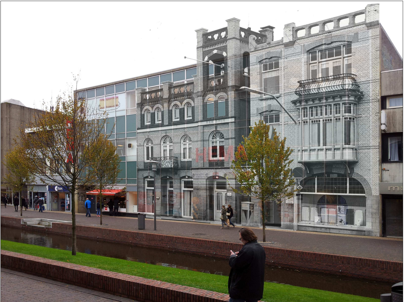
montage van Ons Huis in de huidige situatie

in 3D geprint terug op de Gedempte Gracht