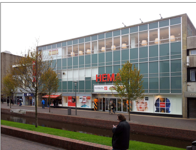
de huidige situatie, nov 2013