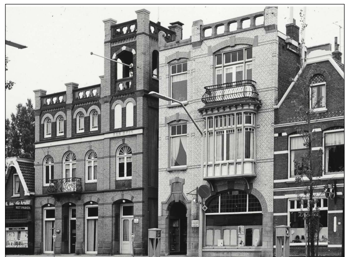
Ons Huis en de drogisterij rond 1960